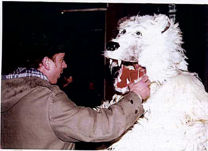
Edateko, ura; lastotxoarekin bada, hobe! 2004.

Hartza, ibilera baldar eta makaleko plantigradoa, bakarzalea da eta banaka edo talde txikietan ibiltzezalea. Esparru ezagunean mugitzea gustatzen zaio eta ez da erasotzailea, mehatxatua sentitzen ez bada behintzat. Gehienak orojaleak dira, baina landareak jaten dituzte batez ere. Negua lo sakonean murgilduta eman arren, negualdia etetzen dute beraien hartzatxoak ernaldu eta titia emateko.