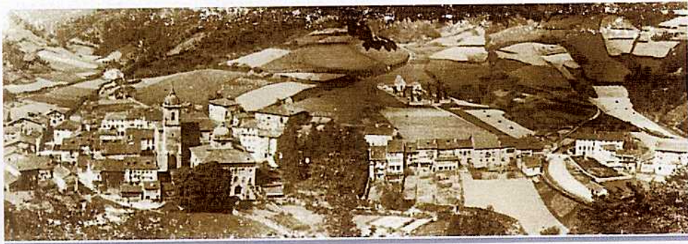
Ermua 1920an, Burduntzali basotik ikusita

Herria, gari-soloak nagusi ziren sasoietan, San Pelaiotik ikusita