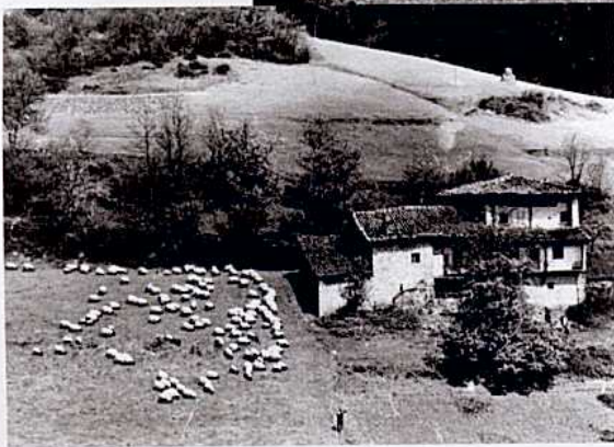
"Ongarai" baserria, gaur eskolak diren lurretan, 1945ean