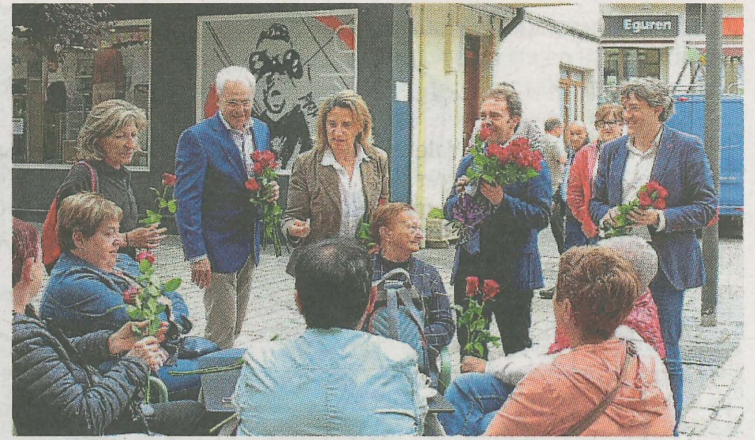
La Ministra repartió rosas y charló con la población ermuarra. A.L.

De este modo, con el sorteo de estas vistas de diferentes rincones del municipio, el colectivo local de pintura, Mugartea, obtiene una recaudación que le permite contribuir, en parte, a su funcionamiento durante todo el año.