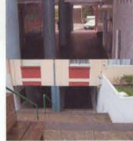
ALDAPA argiztapen urridun eskaileraz beteriko ibilbidea. grandes recorridos con escaleras. escasa visibilidad. escasa iluminación.