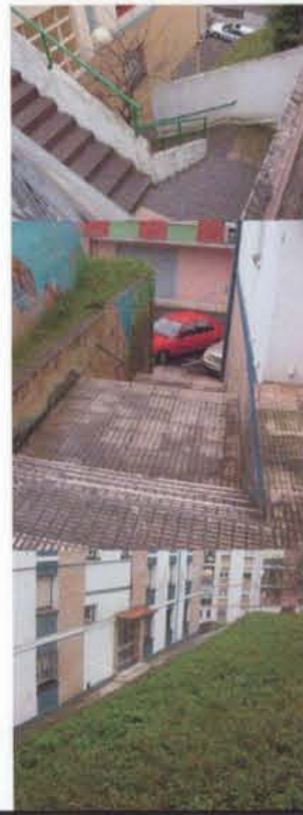
ONGARAI oso erabilia den argiztapen eskaseko pasadizo muy utilizado. sin iluminar. muy profundo