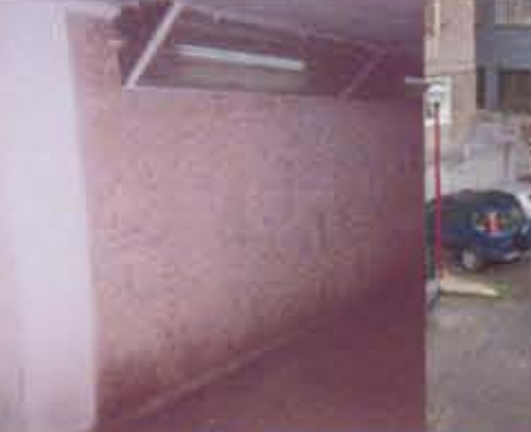
SAN LORENZO AUZUNEA tren geltokira daraman pas- adizo para acceder al ap- del tren. lugares con restos industria-