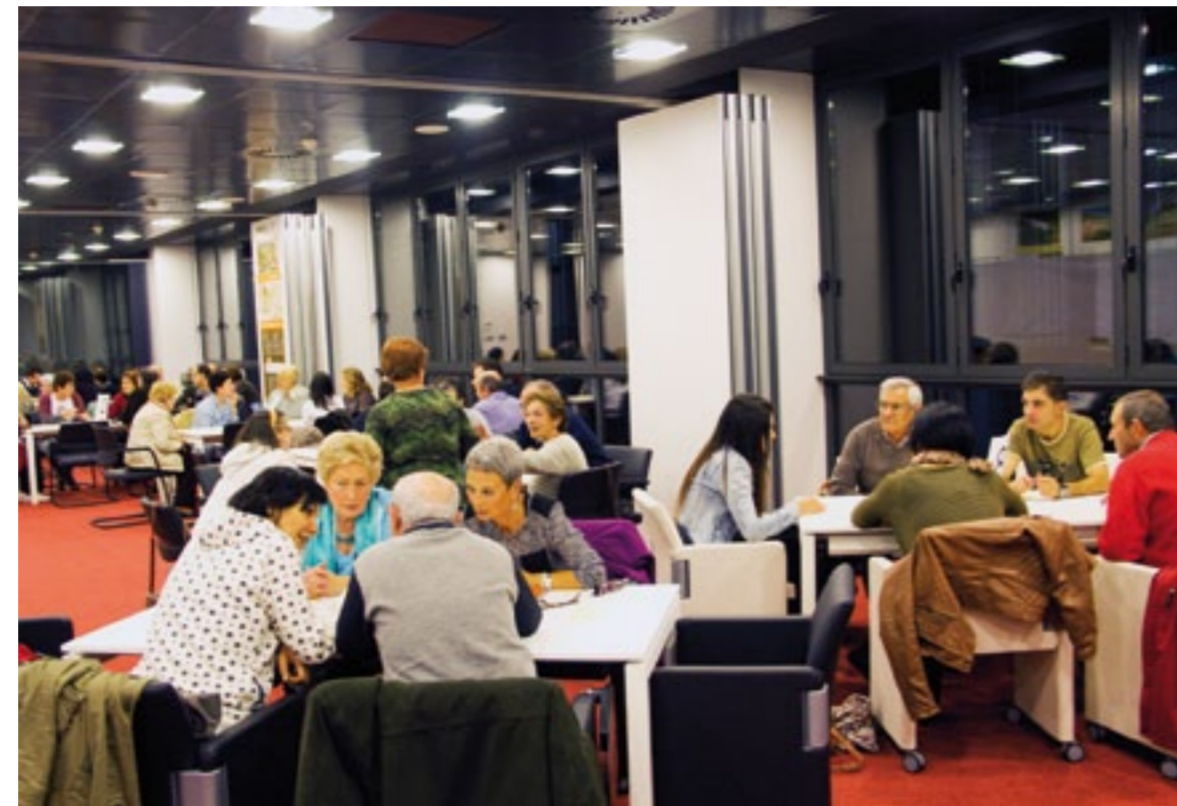
Las personas participantes en las sesiones se reunieron en grupos de discusión pequeños y lo más plurales posibles, evitando grupos de afinidad, para que las propuestas abarcasen temáticas de los más diversos. De cada grupo de participación surgieron preocupaciones de lo más diversas.

El consistorio busca la implicación de la ciudadanía para que no sea simplemente una observadora de los acontecimientos y decisiones de la villa