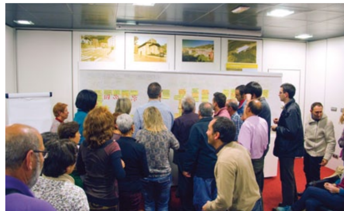
Las propuestas ciudadanas se trasladaron en unos post-it a un mural habilitado para ello. Después, cada participante, debía señalar mediante unas pegatinas, que tres problemáticas les resultaban prioritarias y en las que el Ayuntamiento debía actuar principalmente.

Se han celebrado dos sesiones participativas en las que se fijaron qué asuntos deberían ser prioritarios para el Ayuntamiento y en qué sectores se debería actuar principalmente