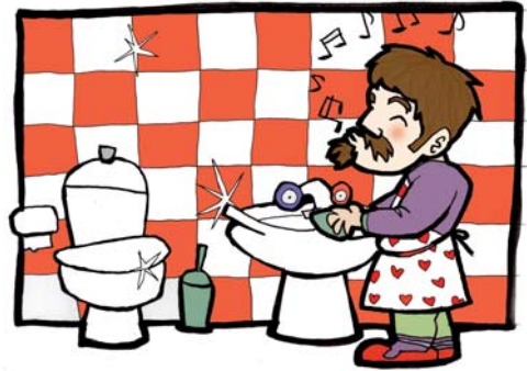
Textos e imágenes cedidas por el Dpto. de Igualdad del Ayto. de Basauri. Calendario 2007.