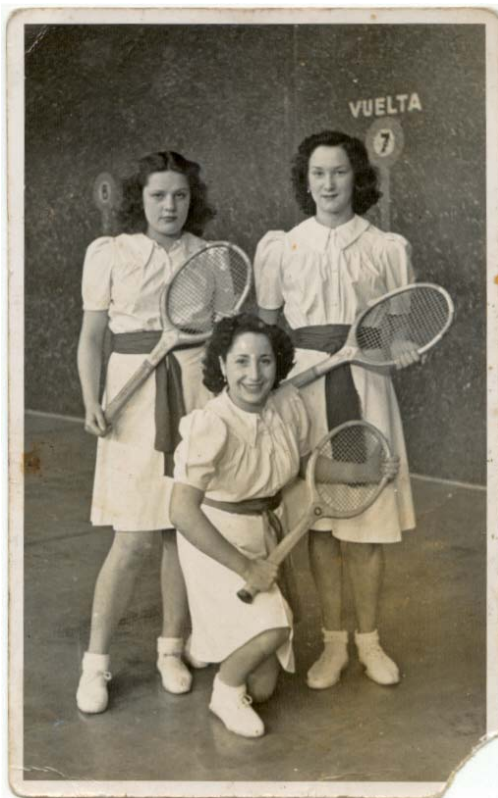
> Fotografía cedida por Maite Gorrotxategi. Maite Gorrotxategik utzitako argazkia.

Jugadoras profesionales con raqueta y pelota de cuero en frontón, iniciaron su andadura allá por el año 1917 hasta los años 60. Al principio, la mayoría eran vascas, de Eibar y Ermua muchas de ellas; luego, a medida que se abrían frontones en otras ciudades, se fueron incorporando mujeres de otros lugares. Empezaban a jugar a muy temprana edad, algunas con 14 años, en los frontones de ciudades como Madrid, Barcelona, Donostia, Canarias, Burgos... y, pasando el charco, en Cuba, Brasil o Méjico.