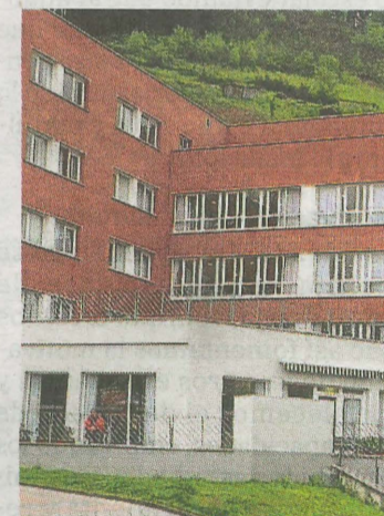
14 años de la residencia. A.L.

Los asistentes se podrán entretener con juegos de mesa (parchís, cartas, dominó, ajedrez...) a partir de las 15.00 horas y a las 16.30 horas dará comienzo el bingo especial con las familias.