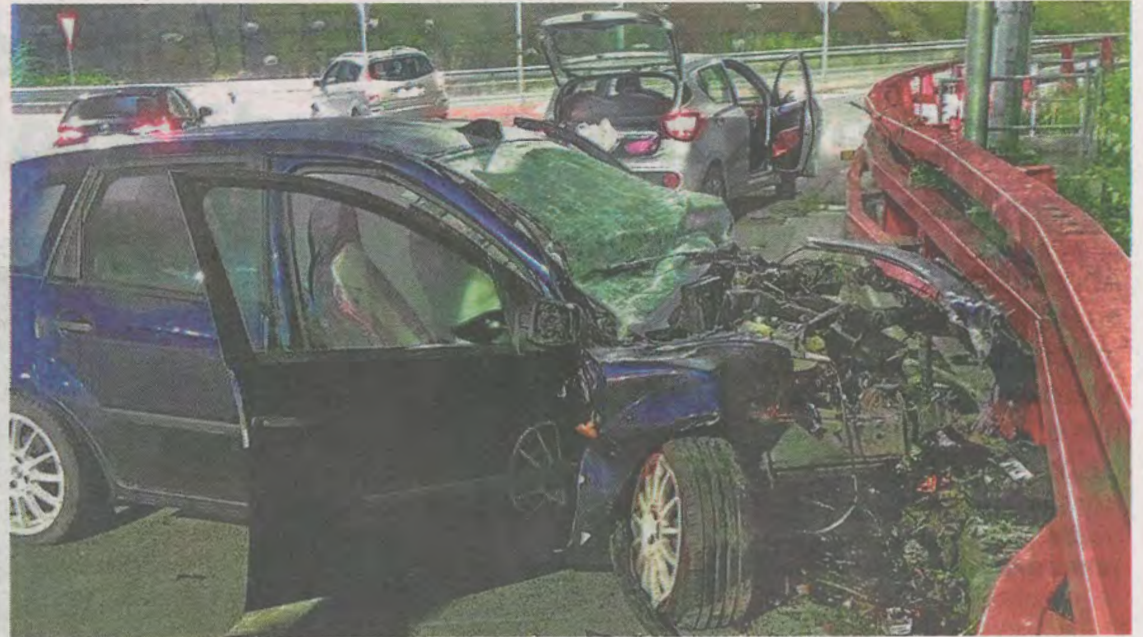
El trágico accidente se produjo minutos después de la medianoche. IGNACIO PÉREZ

La de este año será la última prueba que siga el anterior modelo, ya que en 2024 se aplicarán importantes cambios. Una de las principales novedades será una prueba de madurez. Medio centenar de universidades, entre ellas la UPV/EHU, ven «inviabile» que la nueva Selectividad pueda entrar en vigor en 2024 por el caldo de los cambios. También critican que se les ha «ignorado» en la configuración del nuevo formato.