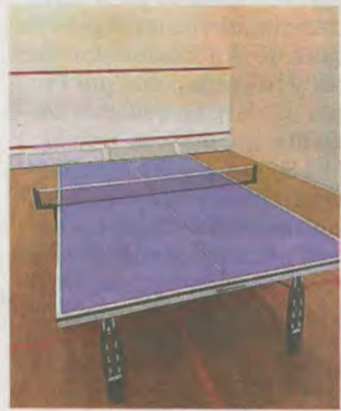
Imagen de la mesa. A.L.

Las personas no abonadas podrán realizar esta práctica deportiva abonando los 5,10 euros de entrada.