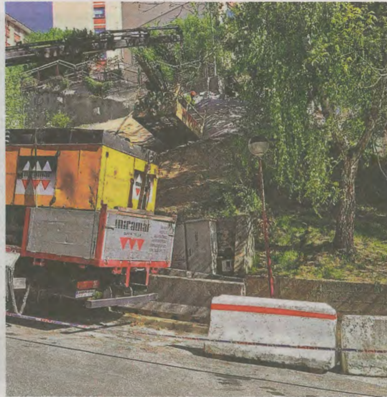
Se utilizan grúas en esta zona de difícil acceso para las obras.

Posteriormente se inyectarán en el terreno tres anclajes nuevos que permitirán evitar futuros desprendimientos en épocas de lluvia.