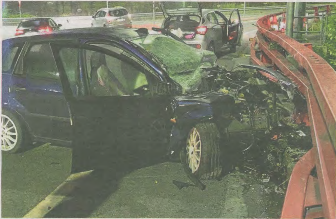
Estado en el que quedó el vehículo del joven vizcaíno tras el trágico accidente. IGNACIO PÉREZ